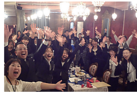
デリシャスパーティー