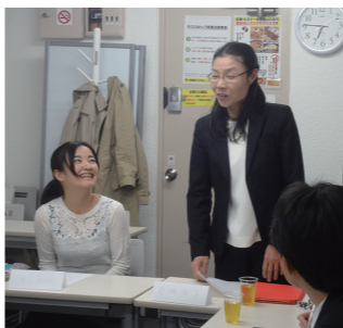
指導員有志会（勉強会）